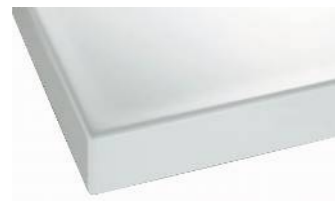
プレーンネオホワイト