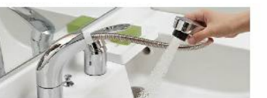
シングルレバーシャワー水栓

微細シャワー 従来比20%の節水タイプ。水ハネも少なく、整流吐水への切替もできます。