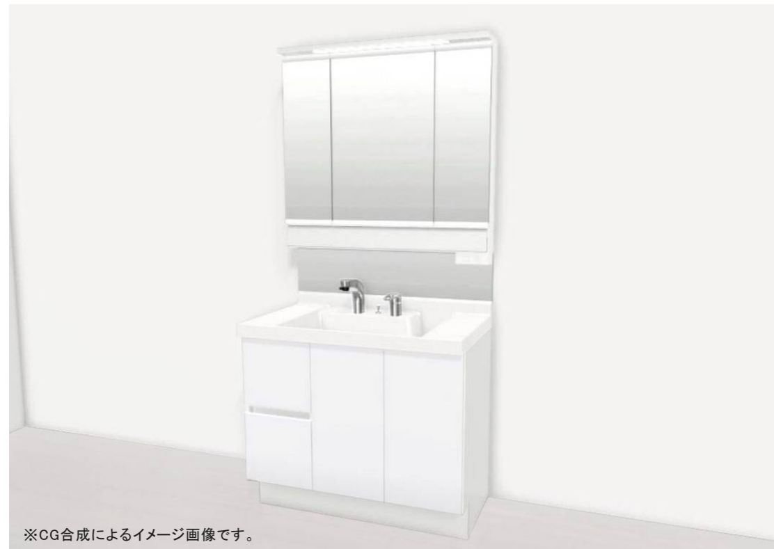
※CG合成によるイメージ画像です。

※商品は物件によって変更になることがあります(当社指定品)。※商品の色柄は印刷物のため実物とは異なります。※イメージ画像は参考です。実際の施工画像ではありません。