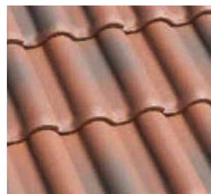
シャドーブレンド ●