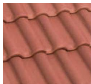
オータムメープル ●