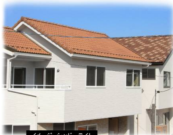
イメージ シャドーライト