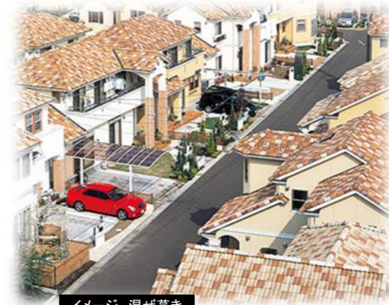
イメージ 混ぜ葺き

ヨーロッパのしなやかな伝統美と、先進の機能を結集して生まれた「セラマウント」。二つの山が特徴的なそのフォームには、日本の街並みと気候風土にマッチする、ハイセンスな機能が凝縮されています。独自の技術や発想で、日本の屋根材に適した耐震性・耐風性・軽量化を実現。また、デザイン性においても、近年の都市型住宅人気に応えるため、ヨーロッパの家々を彷彿させるエレガントなデザインに仕上がりました。