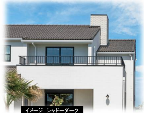
イメージ シャドーダーク