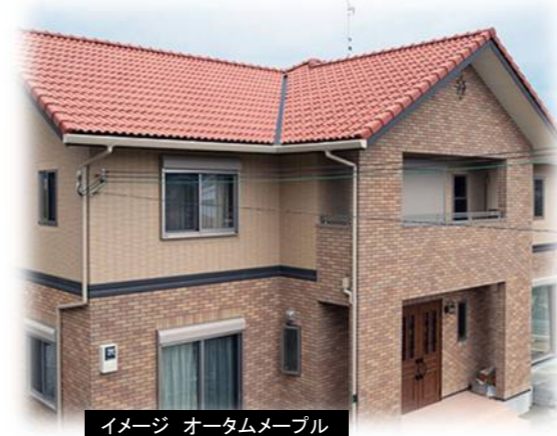
イメージ オータムメープル