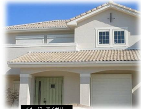
イメージ アイボリー