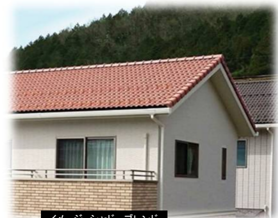
イメージ シャドーブレンド