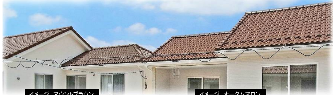
イメージ マウントブラウン

● 窯変色のような色ムラを作為的に表現していますので、不均一な色調となっています。