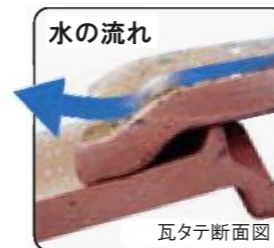
ウォータージャンプ機能