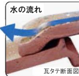
ウォータージャンプ機能