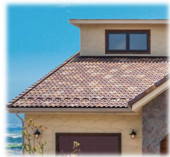
混ぜ葺き イメージ アンバー70%オレンジ20%アイボリー10%