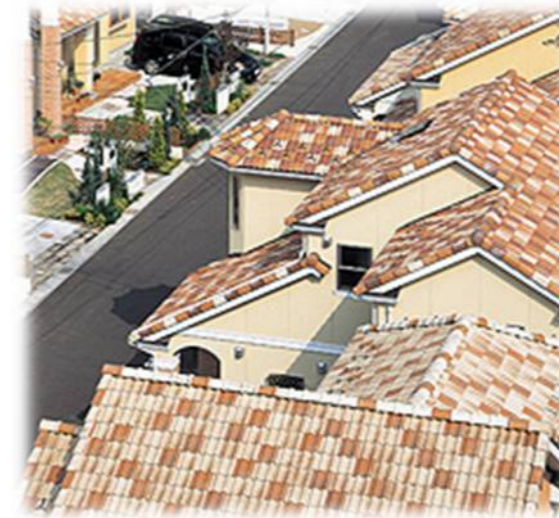
混ぜ葺き イメージ