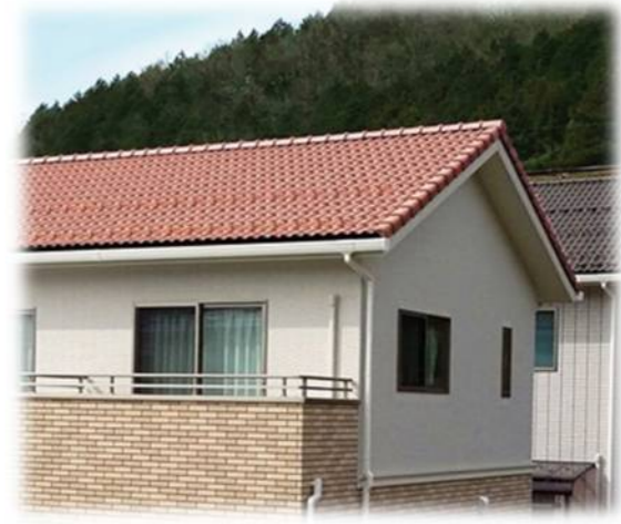
シャドーブレンド イメージ