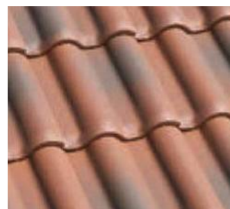
シャドーブレンド ●