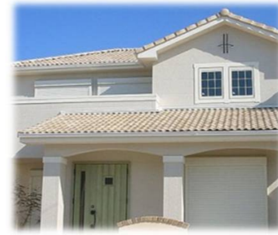
アイボリー イメージ