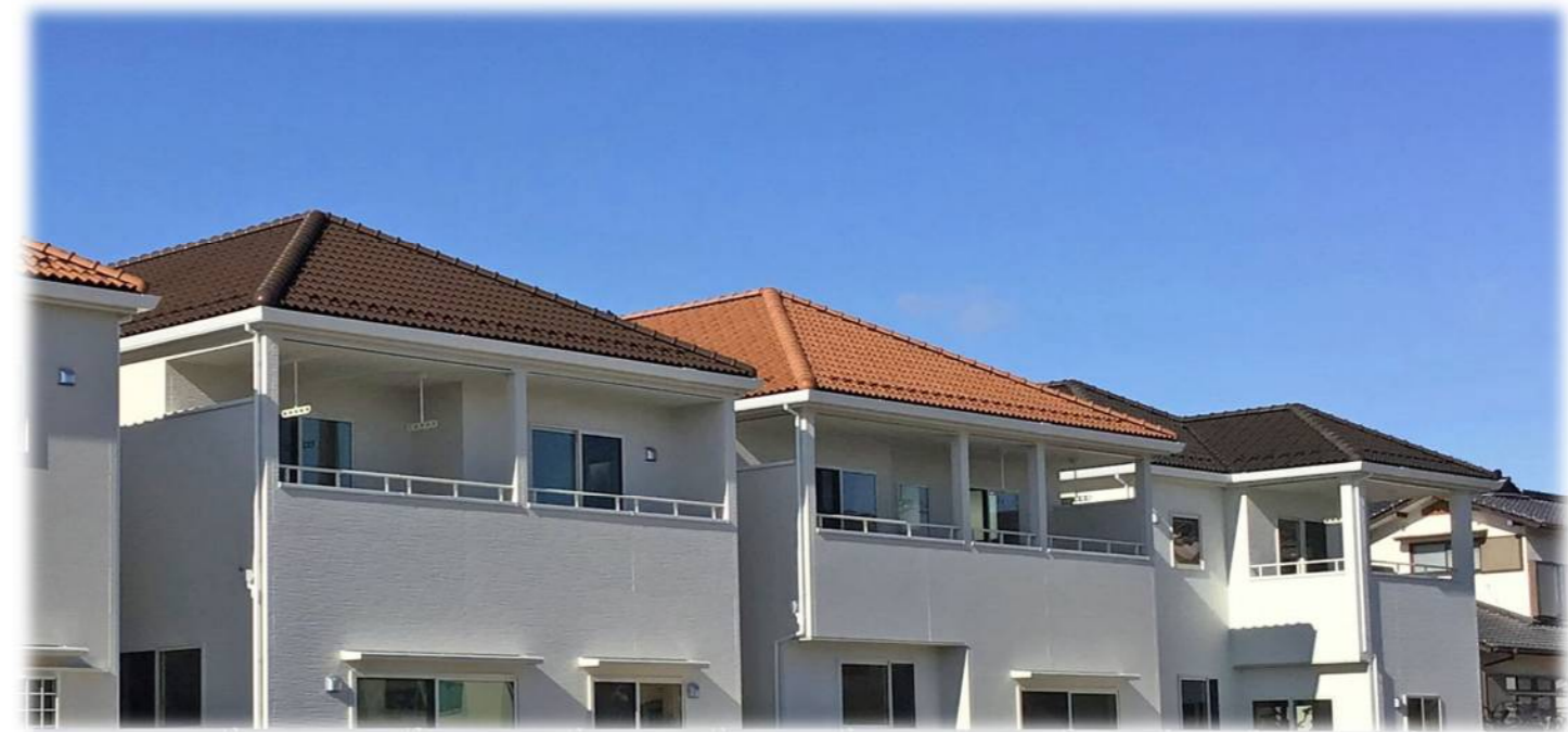
マウントブラウン イメージ