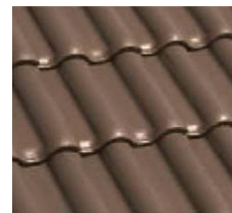
マウントブラウン